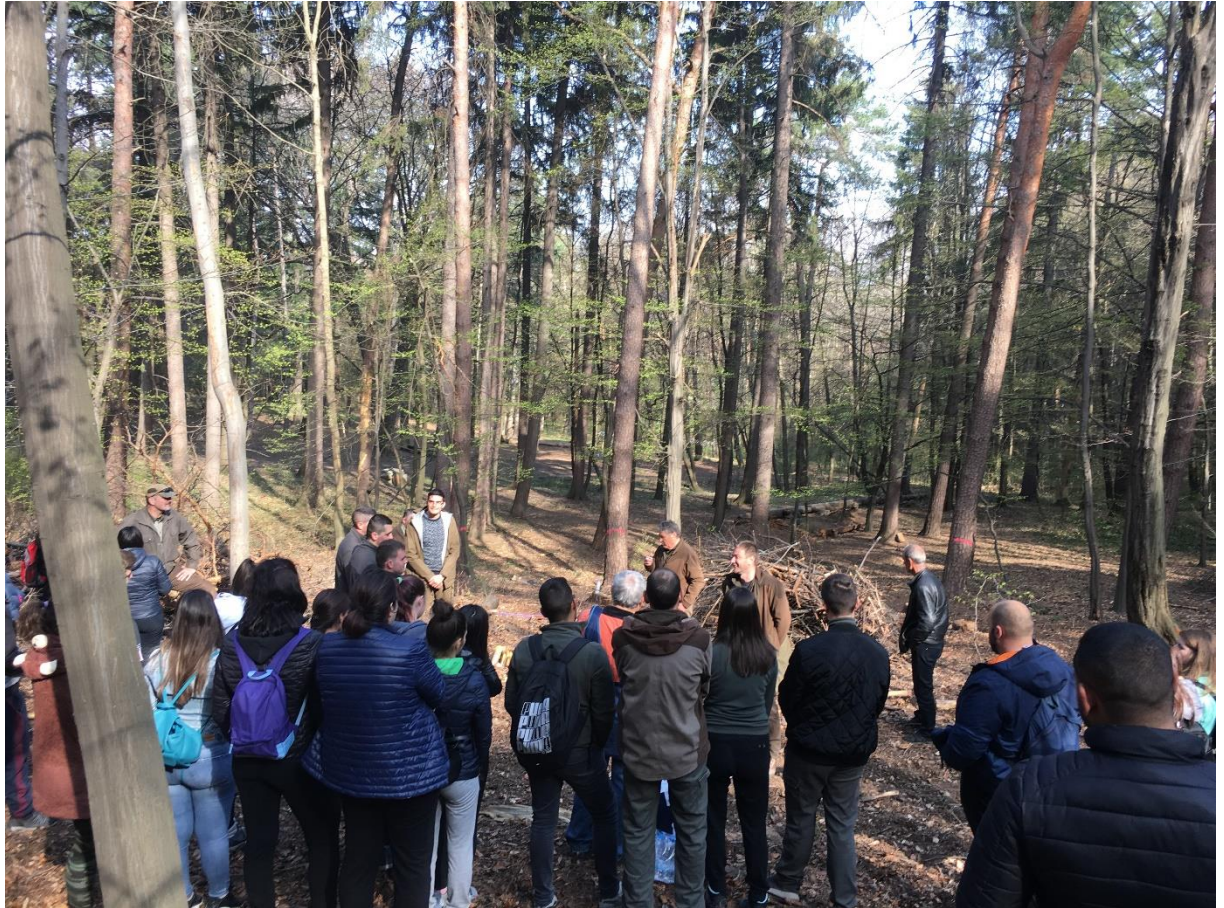
Снимка 3. Разяснителна кампания за залесяване по повод Седмицата на гората.