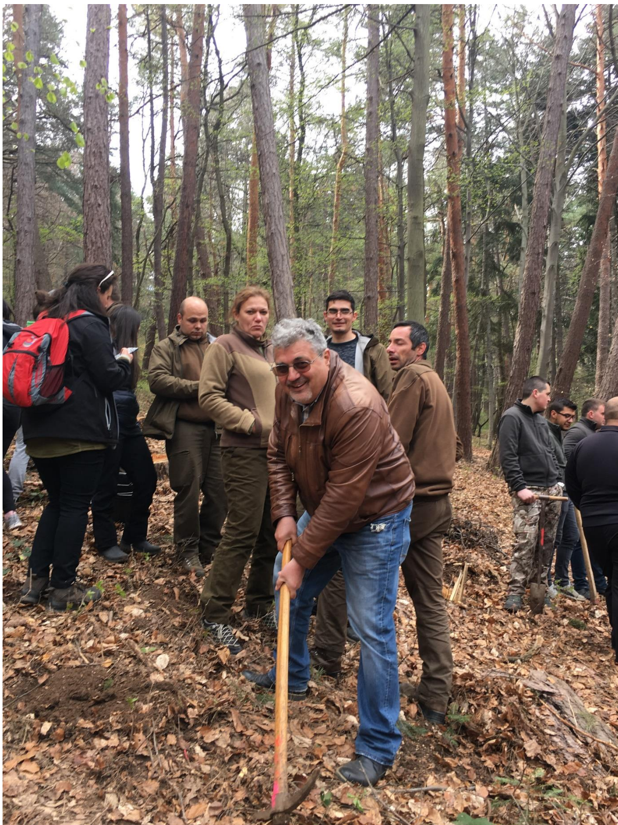
Снимка 4. Ръководителят на ЦНП при ЛТУ взе участие в залесяването по повод Седмичата на гората.

ЦНП взе участие в организираната под егидата на Евро-председателството на Република България и HEInnovate Международна конференция „Supporting Institutional Change in Higher Education“ на 14 и 15.06.2018 г. в гр. Русе, като се включи в иницизираната международна мрежа „heinnovate“ ( https://ltu.bg/bg/ ).