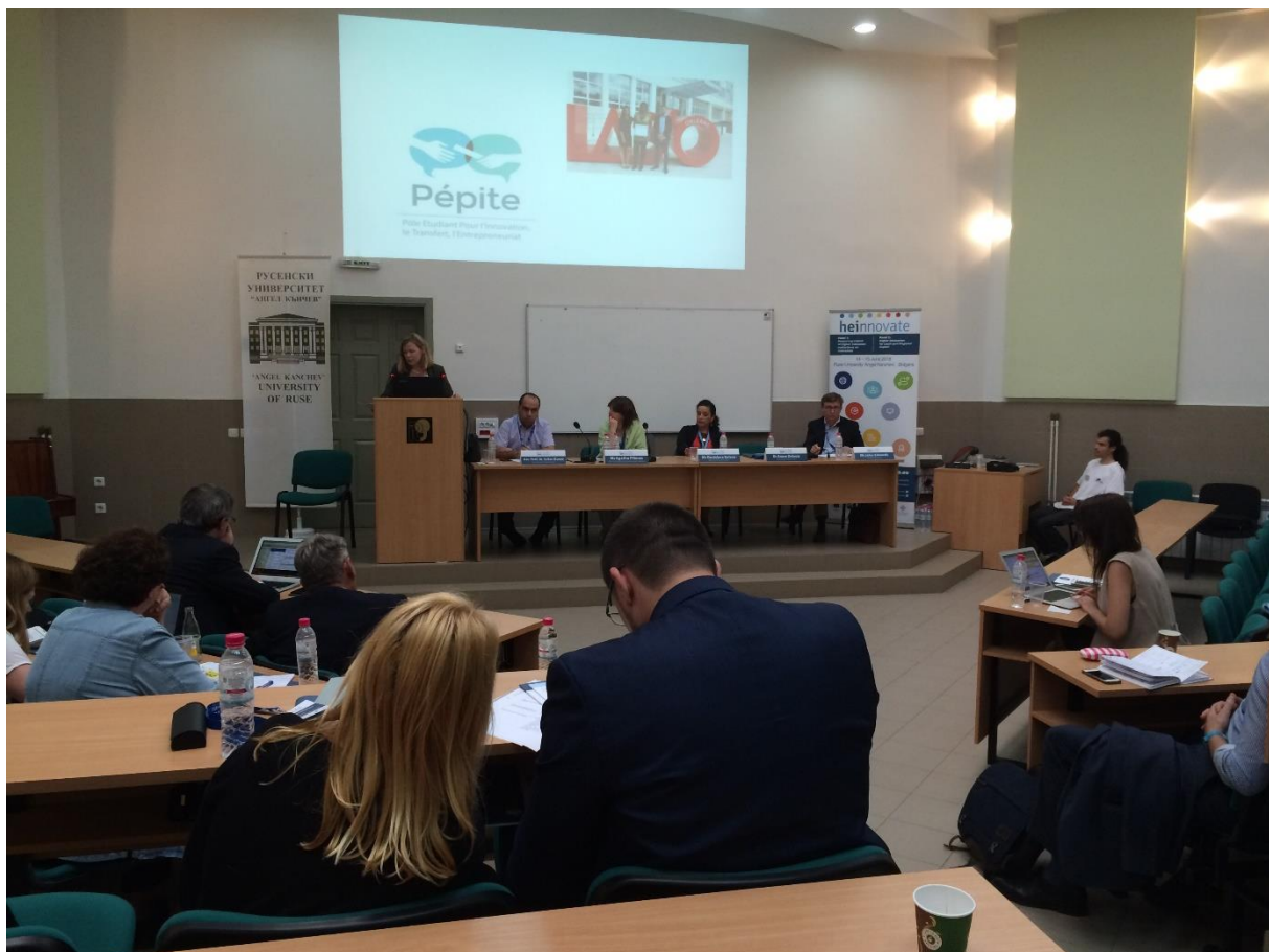
Снимка 6. Работна секция на HEInnovate Международна конференция „Supporting Institutional Change in Higher Education“ на 14 и 15.06.2018 г. в гр. Русе