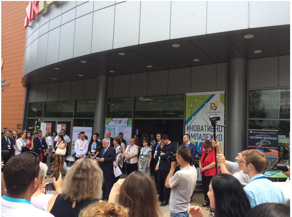
Снимка 5. Тържествено откриване на Център Канев към Технически университет – гр. Русе с участието на ЦНП при ЛТУ.