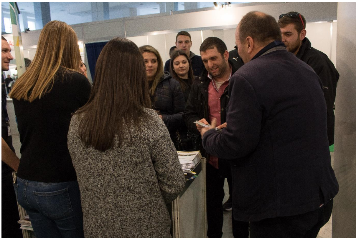
Снимка 2. Щанда на ЛТУ на изложението АГРА – гр. Пловдив в режим на работа със студенти.

През м. април в Седмичата на гората – 2018 бе организирано поредното представяне на Фондация „Еко предприемачество“ пред студентите от Университета и студентите взеха участие в организираното от ЛТУ залесяване.