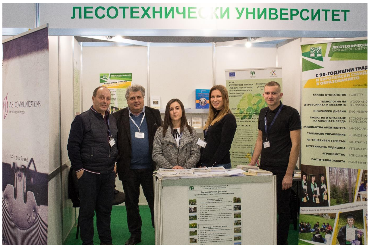
Снимка 1. Щанда на ЛТУ на изложението АГРА – гр. Пловдив

Кратко видео за представяне на ЦНП при ЛТУ.