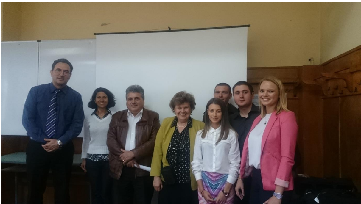
Снимка 13. Дипломанти и научните им ръководители след успешна защита.

В рамките на разработеното проектно предложение „Модернизация на висшето образование по устойчиво използване на природните ресурси в България“ е изготвена концепция за повишаване предприемаческата култура на преподавателите и студентите на ЛТУ, включваща следните дейности: