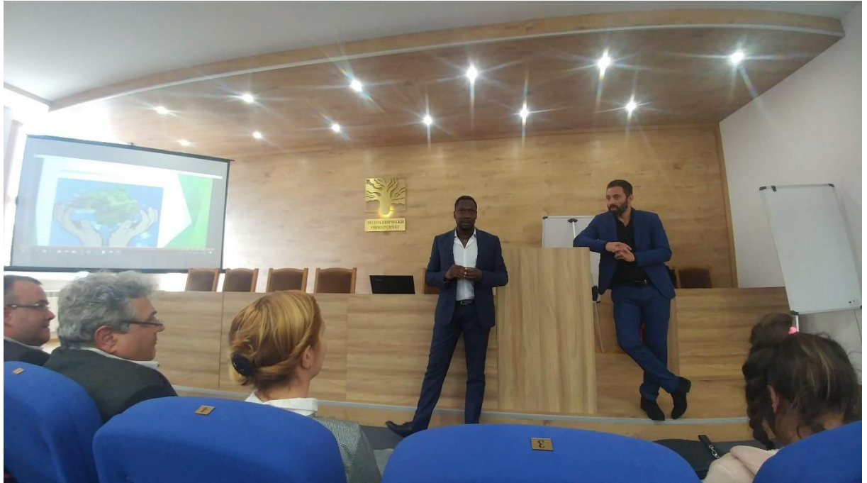
Снимка 10б. Дискусия между учителите от компанията „Големия взрив“ и студенти, преподаватели и гости на Деня на предприемача в ЛТУ.