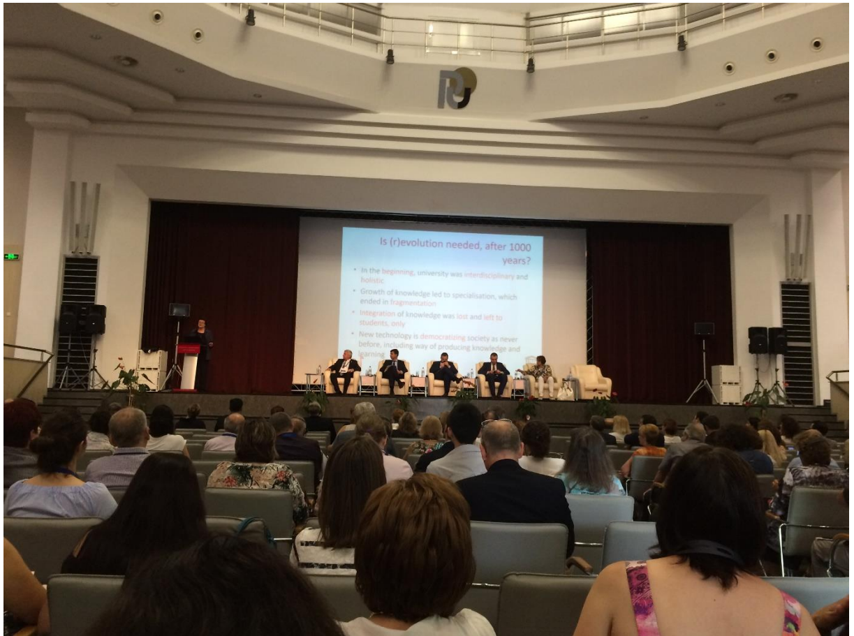
Снимка 7. Заключително заседание на HEInnovate Международна конференция „Supporting Institutional Change in Higher Education“ с участието на СНП при ЛТУ на 15.06.2018 г. в гр. Русе