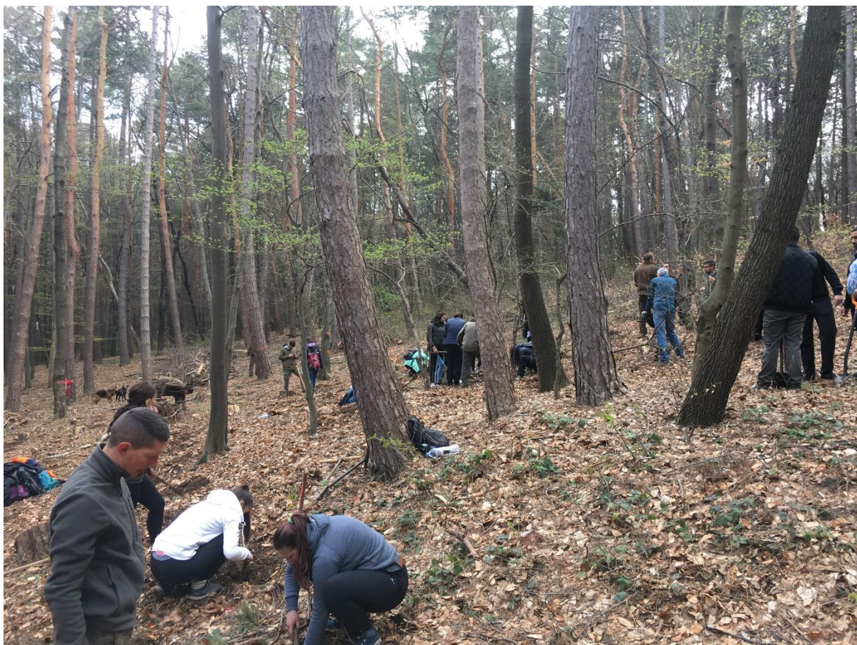
Снимка 3а. Студенти от ЛГУ активно участват в залесяването по повод Седмицата на гората.